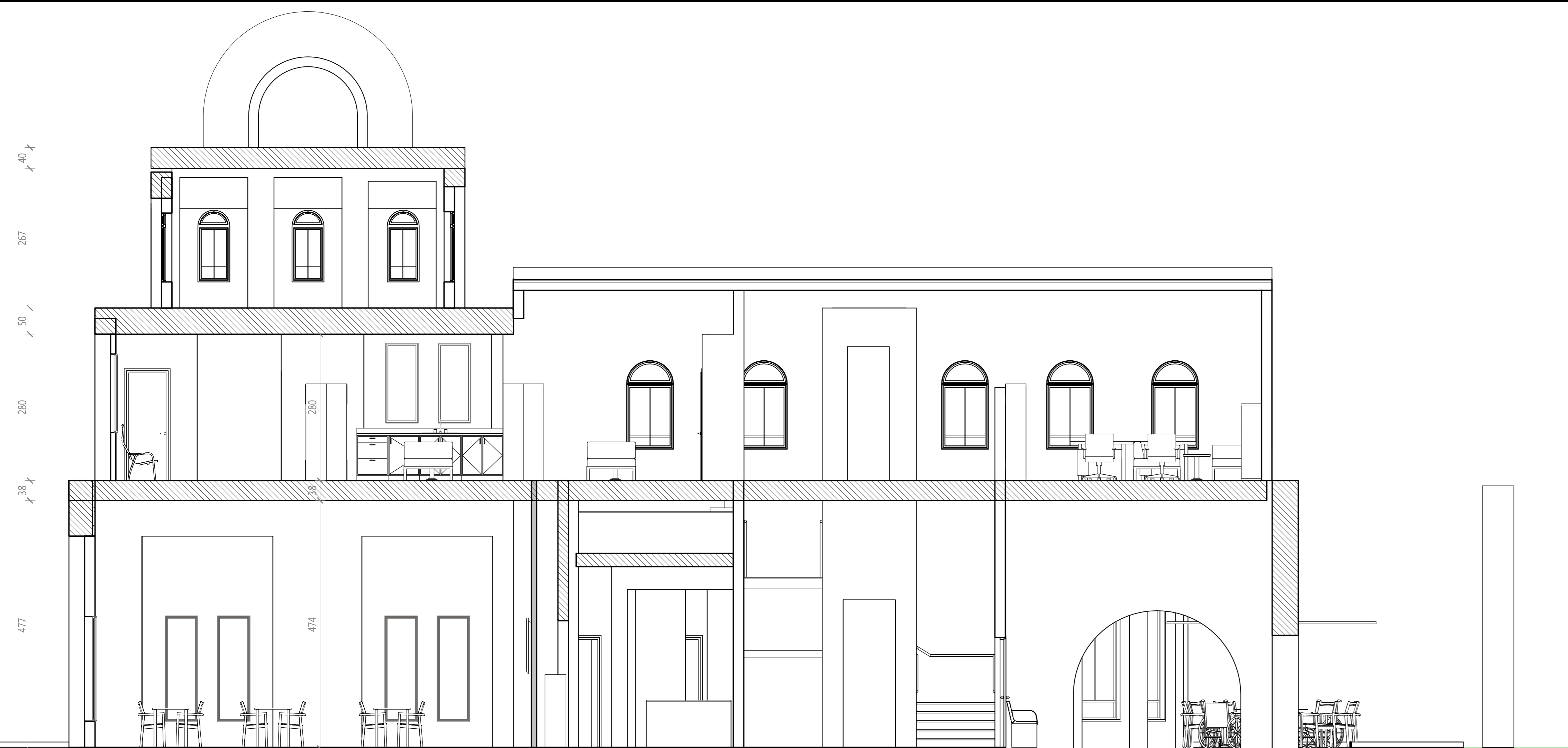
חתך א-א 1 : 50